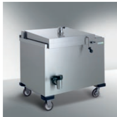
Appareils de cuisson à pression mobile ELRO

Plus de flexibilité pour un rôtissage et une cuisson rapides et sains