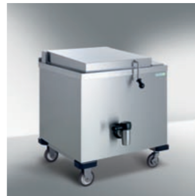
Marmites mobile ELRO

Cuisson saine et efficace, avec ou sans pression