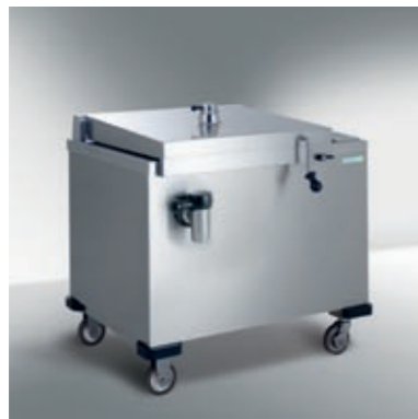
Braisières à pression mobile ELRO

Richesse fonctionnelle et performances maximales pour une cuisson et un rôtissage sains